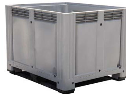
Oppsamlingskasse (gråkar) Kan brukes til flere typer avfall, eks. maling eller EE-avfall