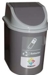
Batteribøtte Beregnet til å lagre brukte batterier i. Størrelse: 2,5 liter