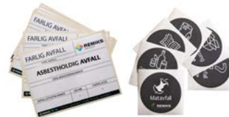
Merkesystem til sortering Inkludert ved bestilling av sorterings-løsning