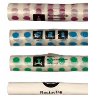
Poser optisk 25 eller 60 liter