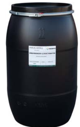
Plastfat Til oppbevaring av farlig avfall, eksempelvis oljefilter (UN-godkjent)