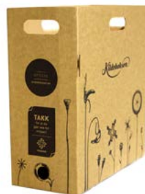
Kildeboksen Passer til optiske poser på 25 l. Plassbesparende design