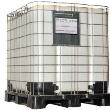
IBC-tank 1000 ltr Til bruk for lagring av ulike typer flytende avfall og diverse annet avfall