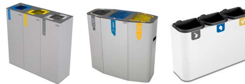
«Alicante» 135 liter totalt «Munich 3» 160 liter totalt «Venus» 22 liter totalt