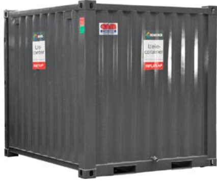
Miljøcontainer Til oppbevaring av farlig avfall. Finnes i ulike størrelser