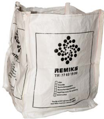
Storsekk/PP-sekk Finnes i størrelsene 1m 3 og 2.5 m 3