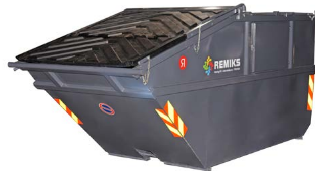
8 m 3 / 10 m 3 Lukket container 8/10 m 3 . Finnes også som sertifisert container til kranløft. Størrelse i meter (LxBxH): 8m 3 = 3.38x1.80x1.50 10m 3 = 3.51x1.80x1.80