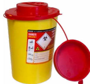
Kanyleboks 2,2 ltr Til stikkende og skjærende avfall