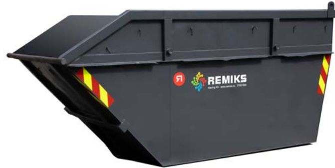
8 m 3 / 10 m 3 Åpen container 8/10 m 3 . Finnes også som sertifisert container til kranløft. Størrelse i meter (LxBxH): 8m 3 = 3.38x1.80x1.50 10m 3 = 3.51x1.80x1.80