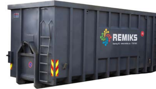
35 m 3 Åpen eller lukket container. Åpnes fra ene kortsida ved behov. Størrelse: 6.00x2.37x2.71 meter (LxBxH)