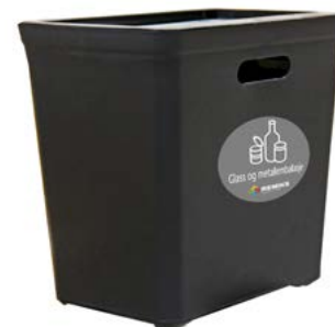
Sorteringsbøtte med lokk Sorteringsbøtte inkluderer veggoppheng. Passer til poser på 25 liter