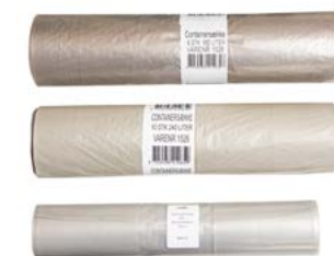
Innersekk Til dunker i standardstørrelser, 140 liter, 240 liter, 360 liter, 660 liter, 1000 liter.