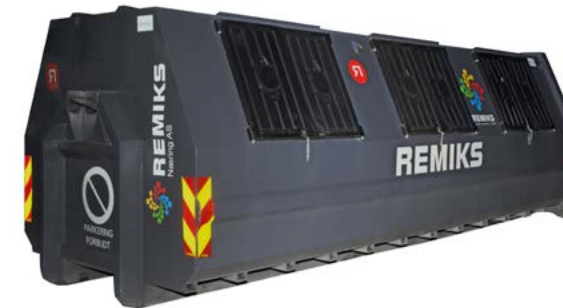
Lukket container Lukket container 15 m 3 , 21 m 3 og 28 m 3 . Størrelse i meter (LxBxH) 15m 3 – 6.00x1.93x1.44 21m 3 – 6.00x2.15x1.79 28m 3 – 6.00x2.37x2.14