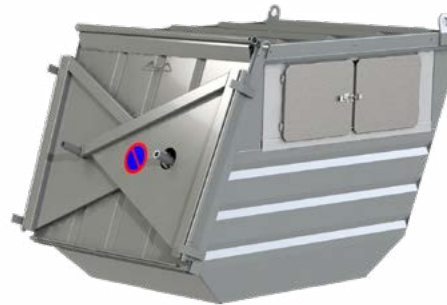
Klappvingecontainer Finnes i størrelsen 4, 6 og 8 kubikk. Passer som permanent løsning for avfall, eksempelvis glass- og metallballasje, optisk avfall eller restavfall.