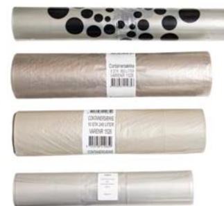
Plastretursekk og restavfallsekk 60 liter, 160 liter og 240 liter