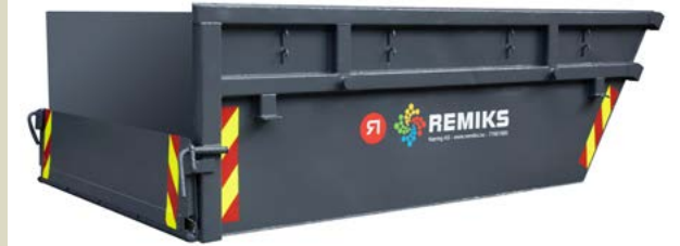
Grusflak Container til tunge avfallstyper, eksempelvis stein. Størrelse: 3,2x1,2x0,4/1,0 meter (LxBxH)