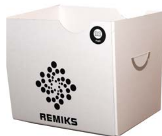
Papireske Til oppsamling av papir innendørs