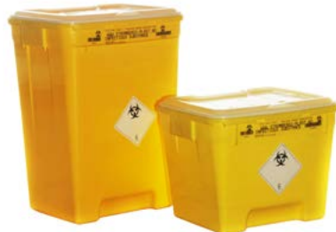
Dunk 50 og 30 ltr Til medisinsk avfall, stikkende og skjærende avfall, patologisk avfall og smittefarlig avfall