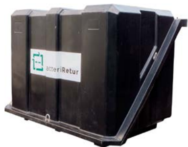
Oppbevaringsboks for kasserte blybatterier