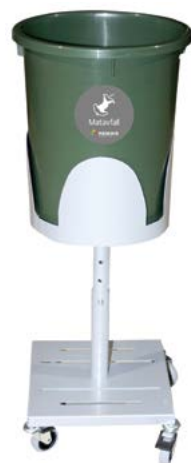
Matbøtte på stativ Stativet er på hjul og kan reguleres i høyden. Volum på bøtte 35 liter. Remiks selger bioposer tilpasset matbøtten