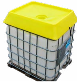
Trakt til IBC-tank Trakt for å unngå søl