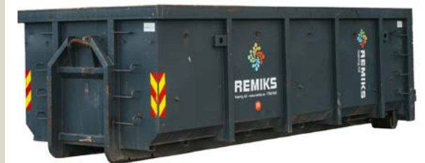
22 m 3 Åpen container. Åpnes fra ene kortsida ved behov Størrelse: 6.00 x 2.365 x 1.785 meter (LxBxH)