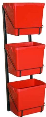
Stativer til EE-avfall Stativ til vegg for tre stk. 25 litersbokser