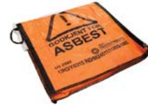
Asbestsekk Storsekk til oppsamling av asbest. Plass til 1100 liter. Størrelse: 1x1x1 meter