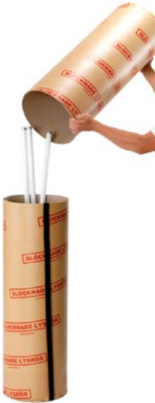
Lysrørbag Bag til oppsamling og transport av lysrør. Plass til mellom 50-80 lysrør.