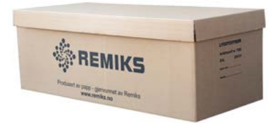
Oppsamlingskasse for lysstoffrør Kasse i resirkulert papp. Brukes til større mengder lysrør